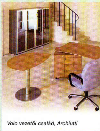
Volo vezetői család, Archiutti

Folytatásként csodáljunk meg egy vérbeli olasz vezetői bútor, a Giottót a Codutti gyár jóvoltából! A kék bőrrrel bevont, lágy ívű lábak szinte lebegtetik a pengevékony asztallapot.