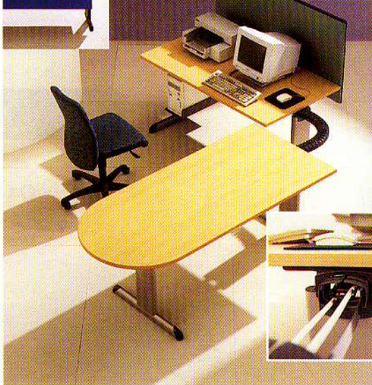
T-form, Archiutti – olasz forma, svájci minőség, italiai gyártmány