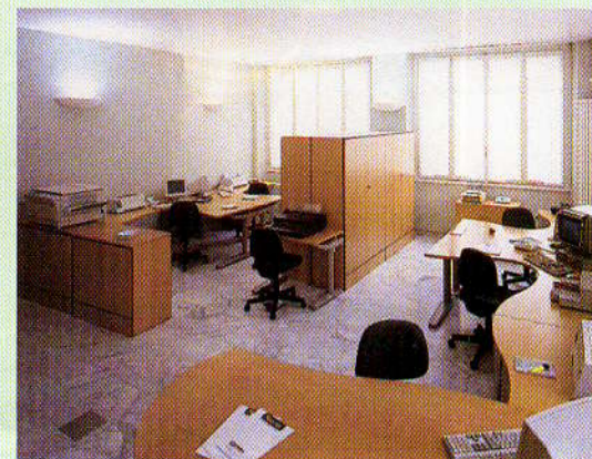
Oasy program, Sacea

A leghétköznapibb igények kielégítésére is sokféle megoldást találunk a gyártók operatív bútorai között. A hagyományos formáktól eltérő megol-