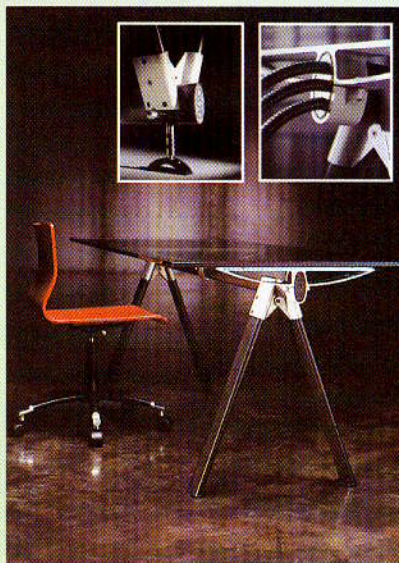
Az IB Office FL 201-es modellje

Folytassuk a tallózást egy másik példával! Az IB FL 201-es modellje egy német technokrata kiállításon