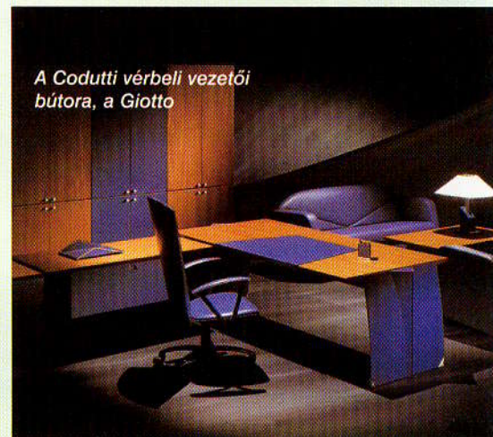
A Codutti vérbeli vezetői bútor, a Giotto

A vöröses mahagónilapok a kék íróbetéttel olyan melegséget árasztanak,