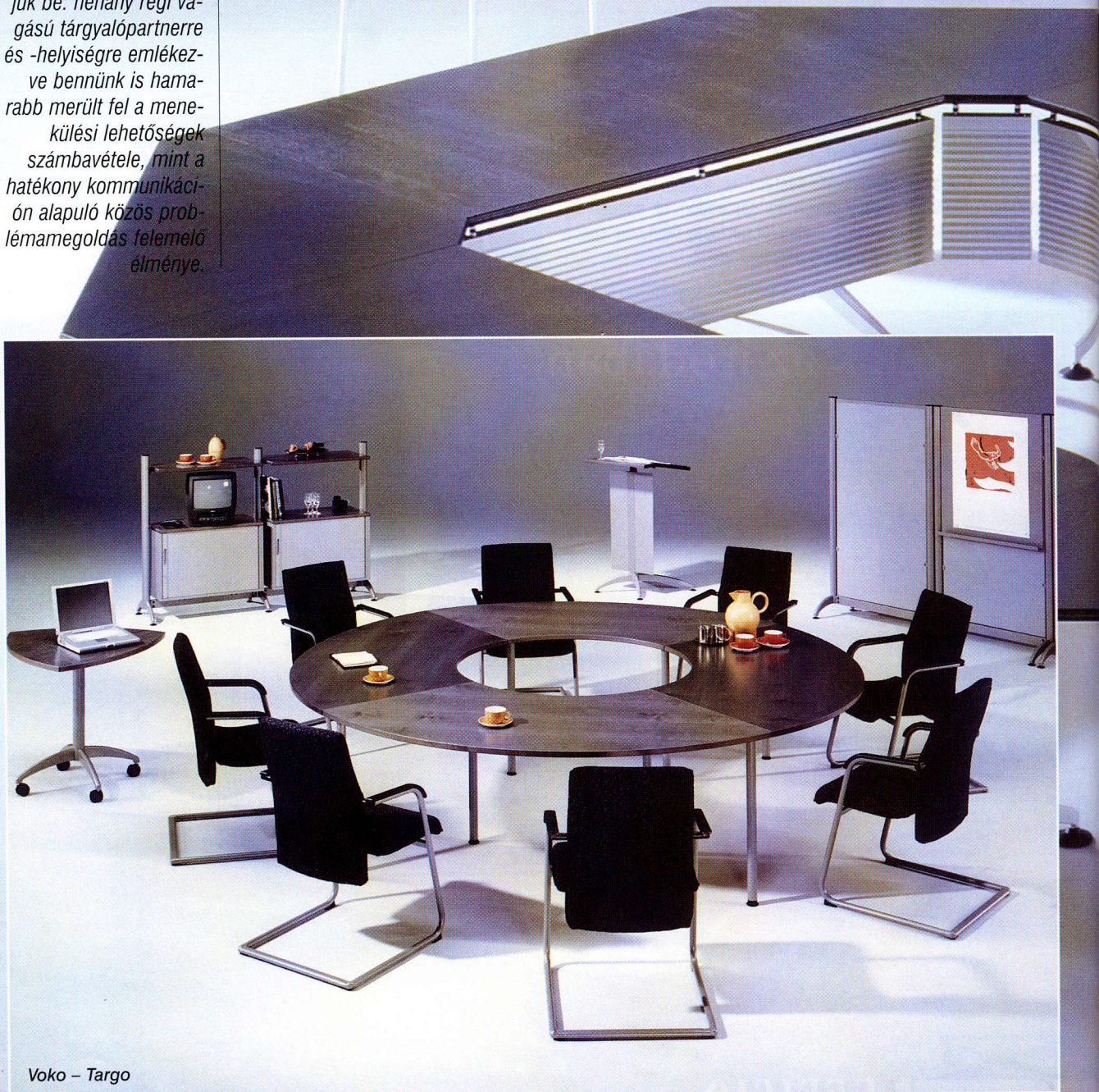
Voko – Targo

lal helyet. Itt is fontos, hogy az irodai ergonómiát leginkább meghatározó négy elem közül egyiket se hagyjuk figyelmen kívül. A hangszigetelés az információk és az intimitás megőrzését szolgálja, a levegő tisztasága és hőmérséklete az éberséget tartja fenn. A megfelelő világítás megoldása is sok gondot okoz, például a fényerő mellett az is lényeges, hogy az előadó felé tekintőket ne kápráztassa a szemükbe sugárzó fény. A bútoroknál a legfontosabb tárgy a kényelmes ülőbútor – de