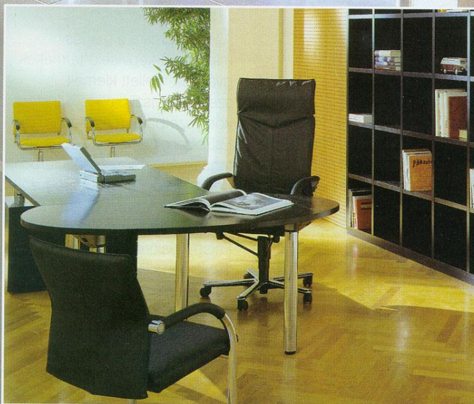
A President család Charles íróasztala

A felső-ausztriai irodaberendező cég, a Hali legfőbb célja olyan helyiségek kialakítása, amelyek motiválják a munkavégzést.