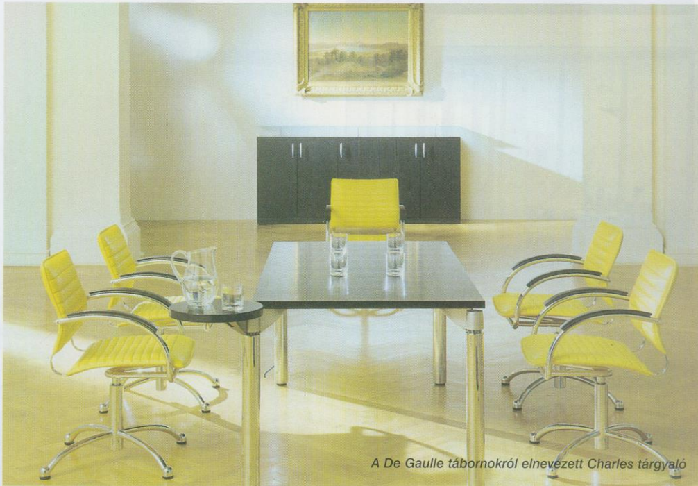
A De Gaulle tábornokról elnevezett Charles tárgyaló

növekvő churn rate-et, az iroda- helyiségek átalakítását is, amely évente 20-30 százalékot tesz ki. Azokban az irodarészekben, amelyeknek védettnek kell lenniük a kíváncsi tekintetek elől, a kommunikációs zónák átlátszó válaszfalait felválthatják a melamin- és furnérfelületű pane-