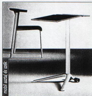
mobli asztal és szék