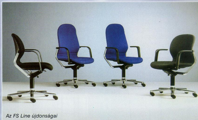
Az FS Line újdonságai