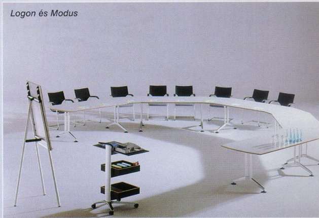
Logon és Modus

gas fokú ergonómiai komfortot ad, ugyanakkor maximálisan védett a vandalizmus ellen. A cég ebben a szegmensben kiharcolt vezető pozícióját az olasz és más nemzetbeli gyártókkal szemben az is jól illusztrálja, hogy a latin design fővárosának, Milánónak a repülőterét is ők rendezték be. A váróterek, recepciók berendezéséhez tartozik többek között a Cana szófa, amely a hagyományos poliuretánhab helyett gumírozott kókuszsháncsot alkalmaz, és filigrán megjelenése ellenére ülőlapja alkalmi fekvőalkalmatossággá is átalakítható. Legutóbbi fejlesztésük az Orgatecen is kiállított Avera család, amely hajlított rétegelt lemez burkolatával, alumíniumlábaival és hármasan tagolt csípőemelt ülőfelületével különleges kényelmet nyújt a luxuskategorián belül.