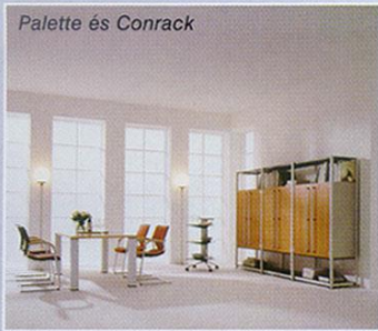
Palette és Conrack

2 millió darabot adtak el 1980 óta. Ez az, ami klasszikussá tesz egy terméket, és csak olyan neveknek sikerült eddig, mint Thonet, Jakobson, Eames vagy Brauer. A három felfüggesztési pont körül rugalmasan mozgó hely forgáspontja pontosan az emberi csípőcsont tengelyébe esik. A legutolsó továbbfejlesztés eredményeként már állítható magasságú kartámasszal és lumbális támasszal is rendelhető ez a klasszikus darab, amelyet egy amerikai építész a székek VW-Bogarának nevezett.